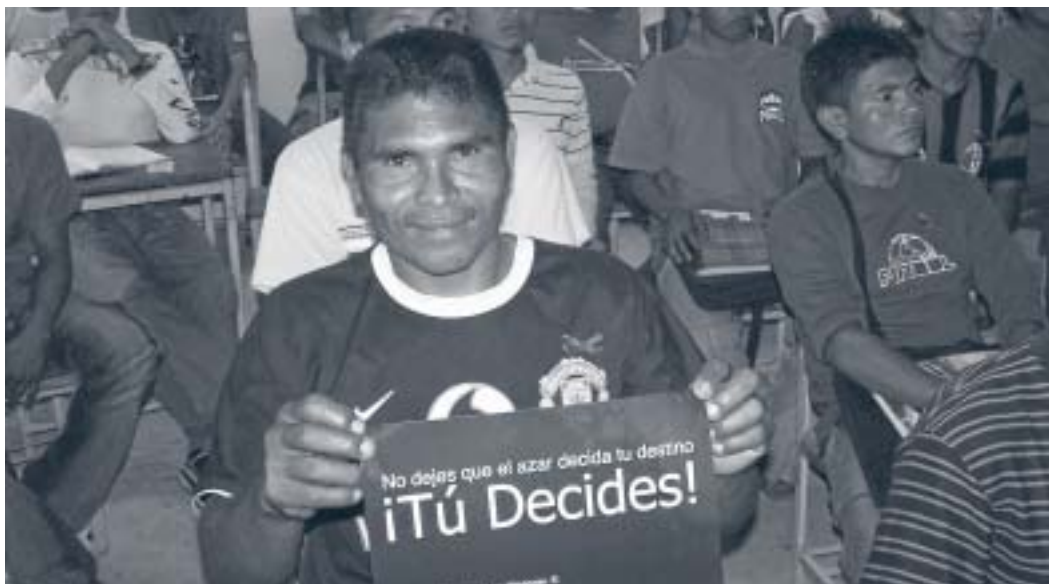
Taller con la comunidad indígena Yukpa en Venezuela

Para que tal participación sea una realidad, cada sector debe tomar acciones específicas, dentro de los procesos de coordinación nacional , en relación a cada uno de los principios de los “Tres Unos”. Estas acciones están descritas en la Parte B de estas directrices.