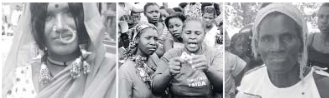
Imagen 1: Trabajadora sexual, India, Imagen 2: Educadora sobre VIH/SIDA hace una demostración sobre el uso del condón, Mozambique, Imagen 3: El Proyecto ACER une a las comunidades en la expansión de servicios, Zambia