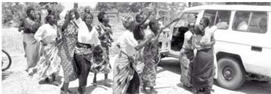
Habitantes de un poblado dan la bienvenida a un equipo móvil de pruebas [del VIH], Zambia