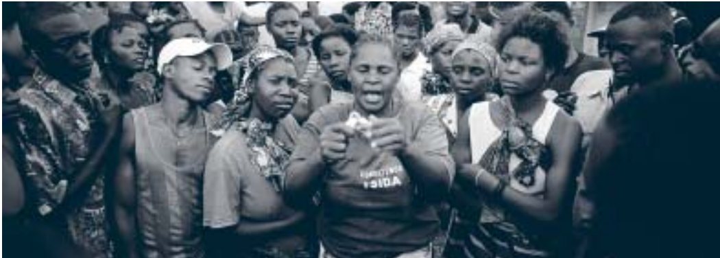
Educadora sobre VIH/SIDA hace una demostración sobre el uso del condón, Mozambique