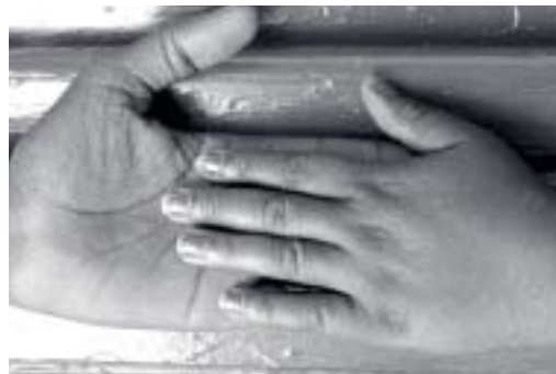
Beneficiarias del Proyecto Naranja, Burkina Faso

“[El] aumento en los recursos, y el correspondiente aumento del número de actores a nivel de país, suelen trastocar los esfuerzos nacionales para coordinar una respuesta multisectorial e incluyente basada en las prioridades nacionales. El resultado es un conjunto de acciones verticales y fragmentadas contra el SIDA que a menudo se duplican y son raramente sostenibles.” 7