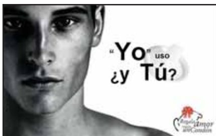
Campaña para promover el uso del condón entre jóvenes gay en Cuernavaca, México @ Edgar Márquez Ortega (2006)