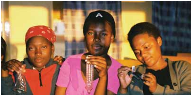
Demostración sobre el uso del condón por parte de educadoras entre pares. Sudáfrica

Sin embargo, el alto precio del condón femenino se debe parcialmente a su demanda limitada, así como al escaso mercado global. En el 2004, por ejemplo, 346 millones de condones masculinos estuvieron disponibles en Sudáfrica, comparado con 3.6 millones de condones femeninos. 79 Si los condones femeninos se mercadearan más agresivamente y fueran percibidos como un método de prevención y una ayuda sexual, su demanda y, por consiguiente, asequibilidad podría aumentar dramáticamente a nivel mundial.