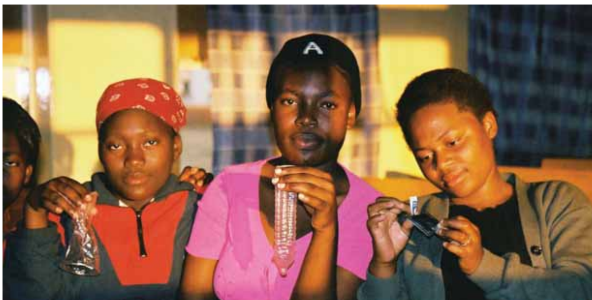
Demostración sobre el uso del condón por parte de educadoras entre pares. Sudáfrica

Nota Informativa de ICASO para la Incidencia Política