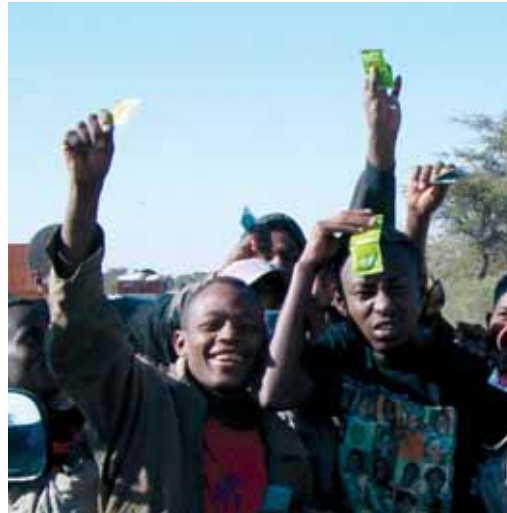
Trabajo con jóvenes para promover el condón en Etiopía @ The Condon Project

En Marruecos, mientras que la mayoría de las personas jóvenes están conscientes de la existencia del VIH/SIDA, su conocimiento sobre la prevención del mismo es extremadamente limitado, incluso en las áreas urbanas. Algunas investigaciones entre estudiantes universitarios indican que menos de dos tercios de los hombres y sólo un tercio de las mujeres identificó a los condones como una forma de protección. El nivel de conocimiento en relación a ese tema entre jóvenes sin educación o menos educados es dramáticamente más bajo. 93 Una evaluación internacional reciente 94 encontró que las niñas que habían completado el bachillerato o educación secundaria tenían un menor riesgo de infección del VIH y practicaban sexo más seguro que aquellas que sólo tenían educación primaria.