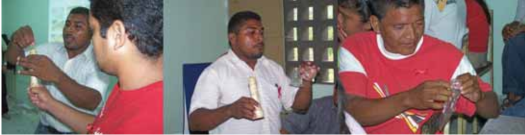
Taller sobre prevención del VIH y uso del condón, comunidad indígena Yukpa, Venezuela @ AMAVIDA 2007