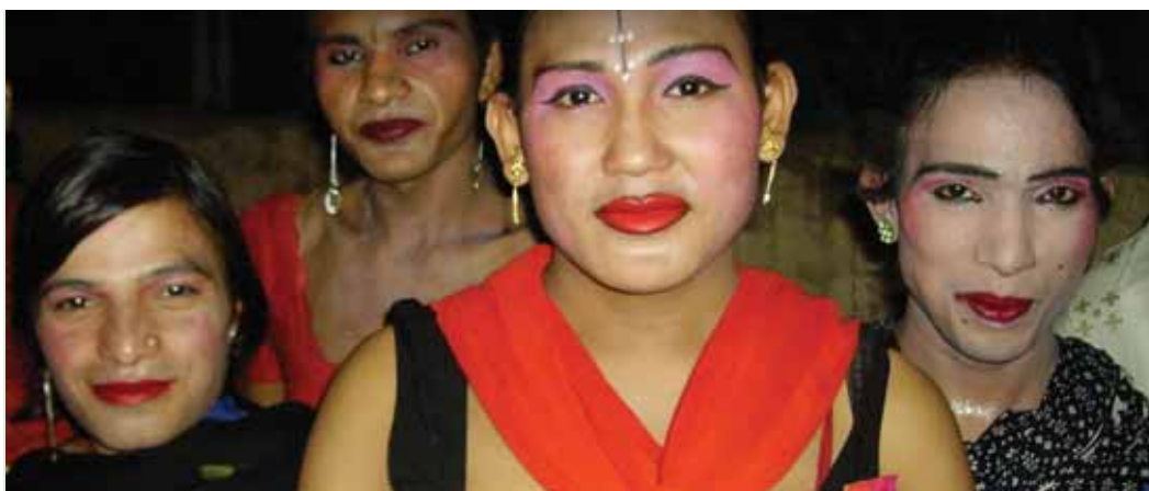
'Khote' / trabajadoras sexuales transgénero en una parada de camiones