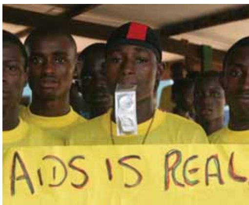
Educadores entre pares durante un evento del Día Mundial del SIDA en Sierra Leone

Este Informe para la Incidencia Política analiza algunas de las barreras que impiden el acceso a los condones, basado en una investigación comunitaria apoyada por ICASO. La información proviene de un proyecto de monitoreo liderado por las comunidades, realizado entre el 2005 y el 2006, que evaluó la implementación de la Declaración de Compromiso sobre VIH/SIDA de la Sesión Extraordinaria sobre VIH/SIDA (UNGASS) de la Asamblea General de las Naciones Unidas. 1